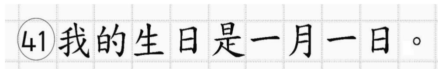
Рис.14. Образец написания иероглифических знаков

иероглифический знак и каждый знак препинания следует писать внутри отдельной клетки области ответов бланка ответов № 2 (дополнительного бланка ответов № 2) (рис. 14).