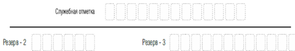
Рис. 5. Поля для служебного использования

Заполнение полей (рис. 6) организатором в аудитории обязательно, если участник экзамена удален с экзамена в связи с нарушением Порядка или не завершил экзамен по объективным причинам. Отметка заверяется подписью организатора в специально отведенном для этого поле бланка регистрации, и вносится соответствующая запись в форме ППЭ-05-02 «Протокол проведения экзамена в аудитории».